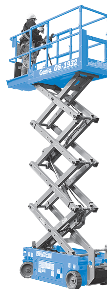
(1) Abonnement 2 ans compris